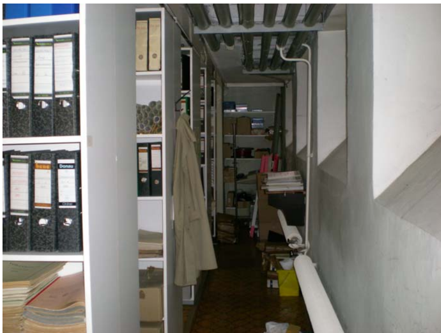
Abb. 2. Großer Archivraum

Das Archiv der Stadtgemeinde Attnang-Puchheim befindet sich im Keller des Stadtamtes. Im ersten Raum sind die Archivalien der einzelnen Abteilungen (Finanzabteilung, Bauabteilung, allgemeine Verwaltung, Amtsleitung) abgelegt. Im zweiten, kleineren Archivraum befinden sich alte, ungeordnete Akten aus der Zeit vor 1945, sowie weitere Unterlagen der Abteilungen. Auch in den Büroräumen der Bediensteten und vor allem in der Amtsleitung sind weitere Archivalien verwahrt. Die Verwaltung des Archivs erfolgt durch die Abteilungsleiter bzw. den zuständigen Sachbearbeitern. Der Zugang zum Archiv ist mittels eines eigenen Schlüsselsystems geregelt. Die Stadtgemeinde hat keine eigenen Organisationsvorschriften das Archiv betreffend erlassen. Als Richtlinie gelten die gesetzlich vorgeschriebenen Aufbewahrungsfristen. Auch gibt es keine Benutzerordnung für das Archiv.