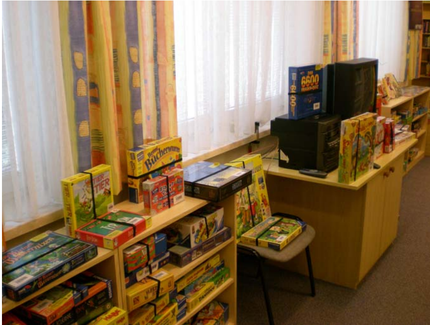
Abb. 8. Hier entstehen die zwei Arbeitsplätze für die Archivbesucher/innen