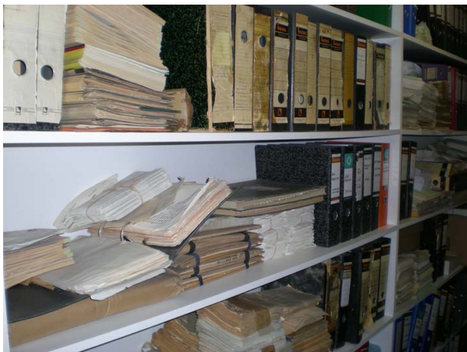
Abb. 3. Detailansicht des großen Archivraumes