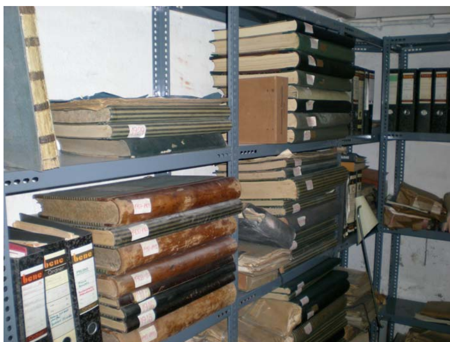
Abb. 4 Kleiner Archivraum / Überwiegend Archivalien aus der Zeit vor 1945