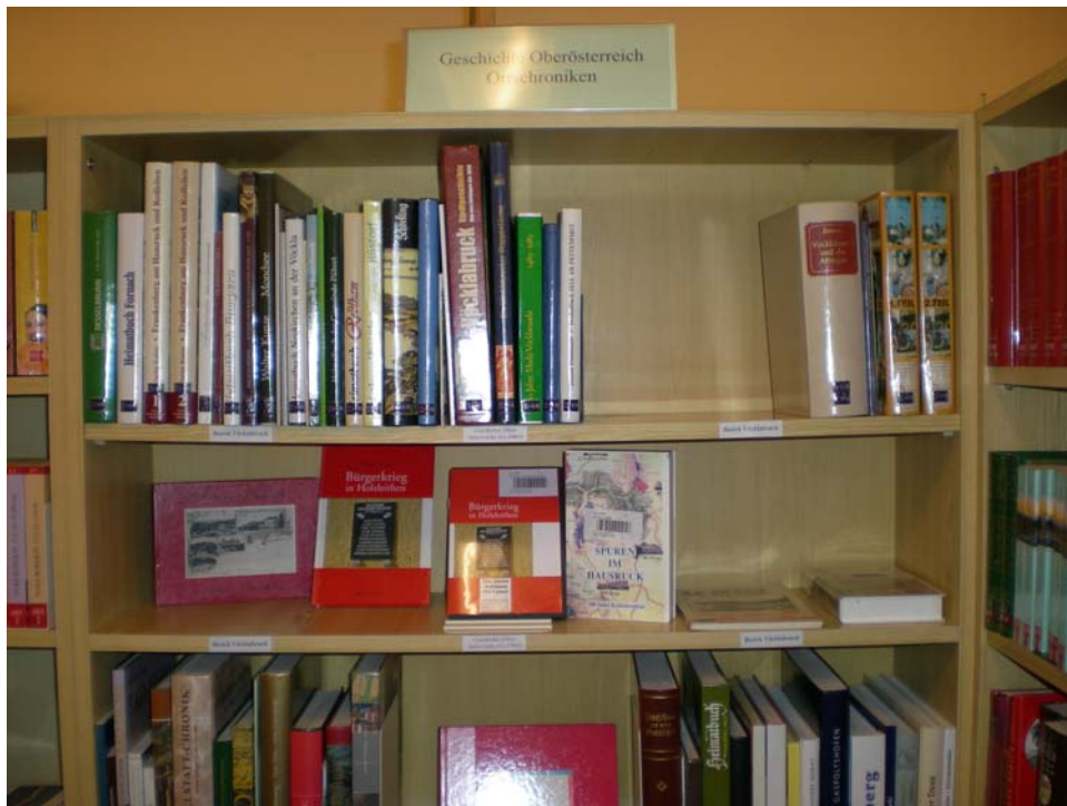
Abb. 1 Ausschnitt aus dem Regal mit den Werken zur Geschichte Attnang-Puchheims und deren Umgebung

Als Vorbereitung auf die Vernetzung zwischen Bibliothek und Archiv wurde schon vor geraumer Zeit mit dem Ankauf von Publikationen zur Geschichte Oberösterreichs begonnen. Neben den Überblickswerken finden sich hier die Werke über Attnang-Puchheim und einen Großteil der Ortschroniken der Bezirke Vöcklabruck, Gmunden, Grieskirchen und Wels-Land 3 . In Zukunft soll diese Erwerbstätigkeit fortgesetzt und noch weiter forciert werden. Vor allem Werke, die für eine vernünftige Benutzung des Stadtarchivs von Bedeutung sind, sollen noch angekauft werden.