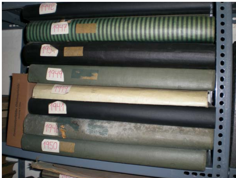
Abb. 5. Handschriften aus dem kleinen Archivraum