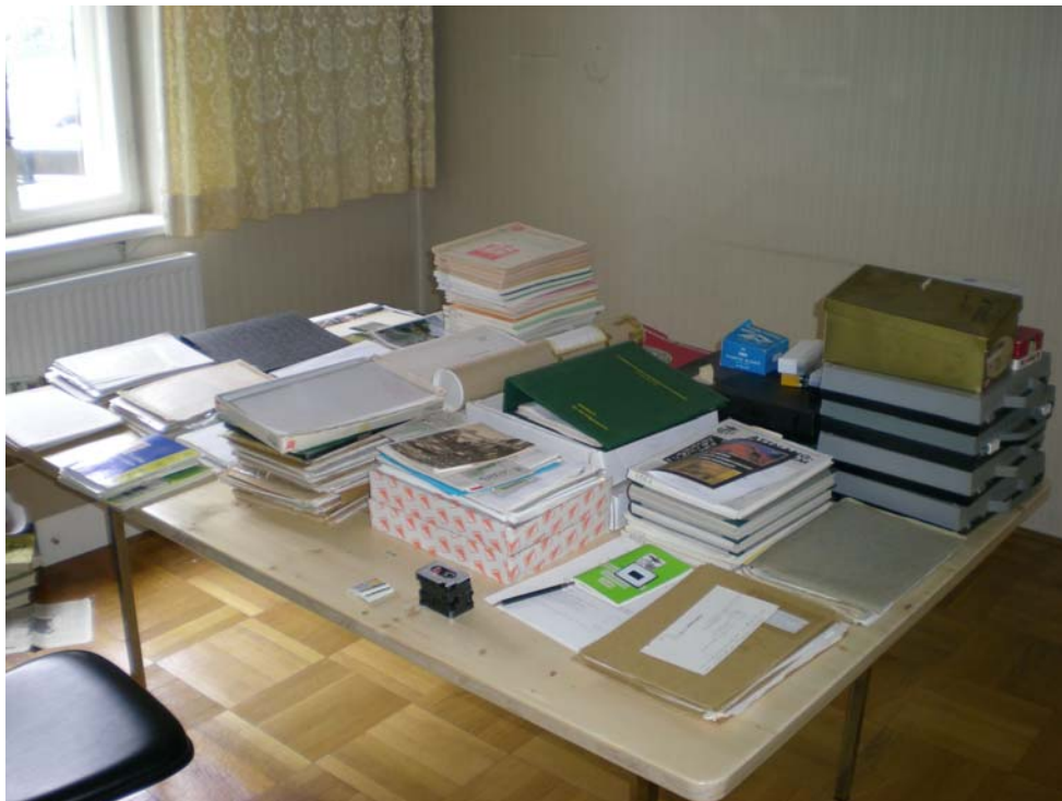
Abb. 7. Arbeitsplatz zur Neuordnung

Nach der Beendigung der formalen Neuordnung und Aufstellung des Stadtarchivs wird es notwendig sein eine Benutzerordnung 26 zu erlassen und das Archiv mithilfe der Stadtbibliothek und anderen Institutionen und Personen inhaltlich aufzuarbeiten und zu präsentieren.