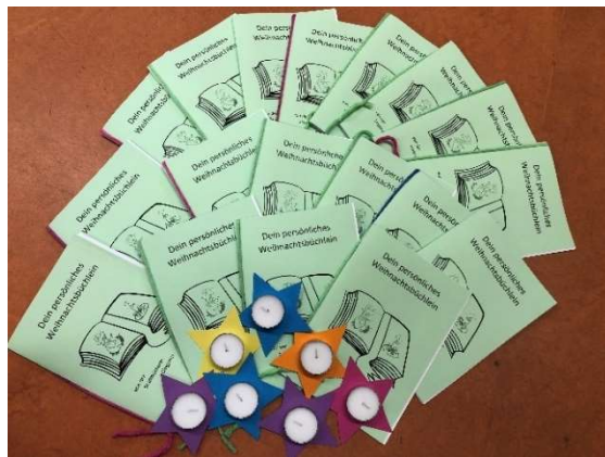
zu 5.1.4. Weihnachtsgeschichte „Wie der kleine Esel das Weihnachtswunder fand“