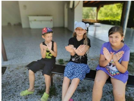
zu 5.1.3. Weihnachtspost