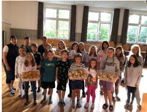
zu 5.1.12. Märchenlaternenwanderung