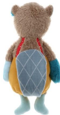
Abb. 1 – 2