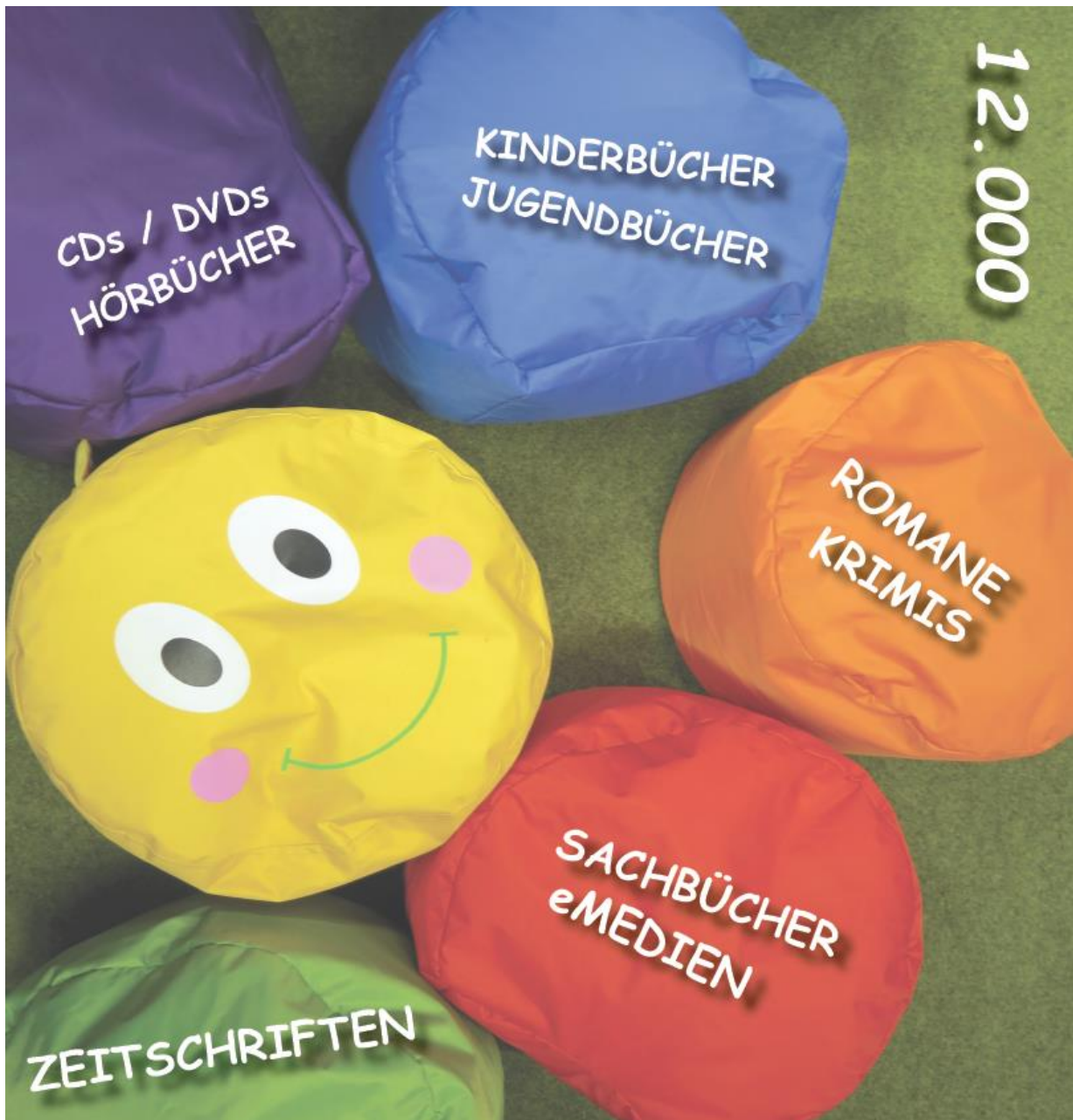
Abbildung 7: Innenseiten des Flyers

Auch für die beiden Innenseiten beschränkten wir uns auf die meiner Meinung nach wichtigsten Informationen und ein aussagekräftiges Bild. Auf dem Bild sieht man die bunten Sitzpölder des Kinderbuchbereiches der Bücherei. Der Sitzpölder in der Mitte hat ein freundliches lachendes Gesicht und auf den anderen fünf Sitzpöldern steht immer eine Mediengruppe, die es in der Bücherei gibt: CDs/DVDs Hörbücher; Kinderbücher Jugendbücher; Romane Krimis; Sachbücher eMedien; Zeitschriften. Die Zahl 12.000 in der oberen rechten Ecke steht für den gesamten Medienbestand der Bücherei.