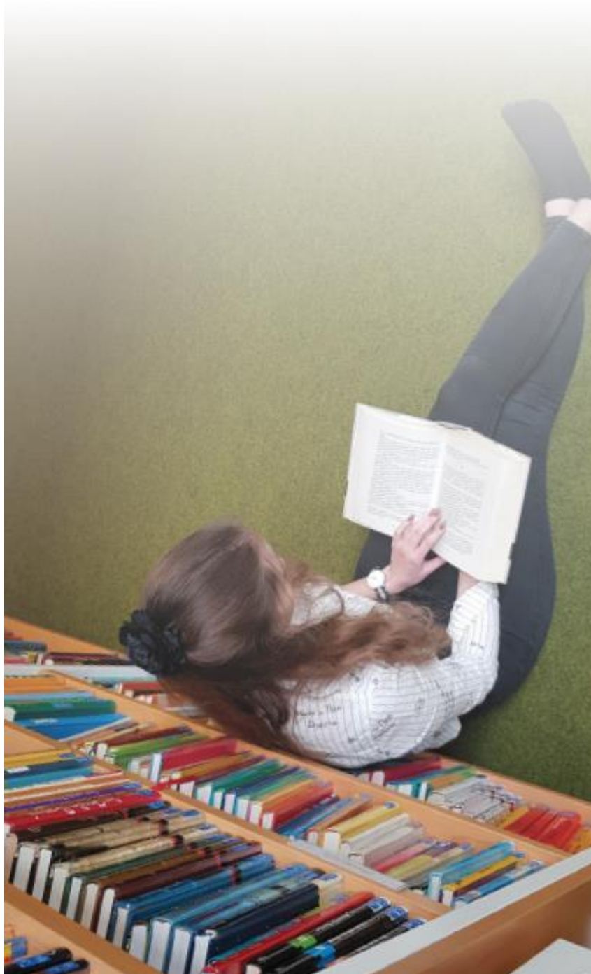
Abbildung 6: Vorderseite des Flyers