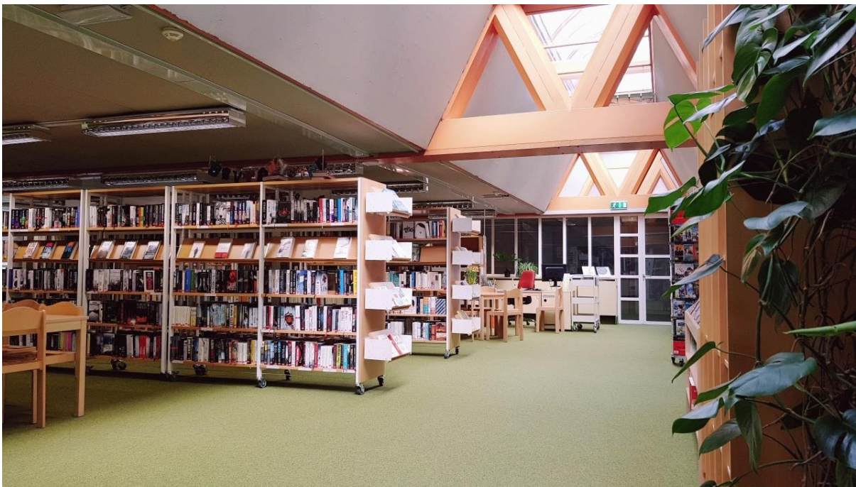
Abbildung 3: Bücherei vom Eingang

Die Bücherei befindet sich in der Mitte des Schulgebäudes und ist nur durch Glasscheiben vom restlichen Gebäude getrennt. Dadurch ist die Bücherei sehr gut einsehbar und wird auch als Durchgang genutzt. Die Schülerinnen und Schüler der Schule nutzen die Bücherei auch sehr gerne als sozialen Treffpunkt vor dem Unterricht in der Früh und auch in den Freistunden. Auch viele Lehrpersonen besuchen mit Schulklassen die Bücherei. Im hinteren Bereich der Bücherei sind Computer, welche die Lehrer sehr gerne zur Recherche mit Schulklassen nutzen. Der Raum der Bücherei ist 180m 2 groß und freundlich eingerichtet. Es gibt einen großen Tisch mit 10 Sitzplätzen und einen kleinen Tisch mit 6 Sitzplätzen. Im hinteren Bereich befinden sich wie schon erwähnt 10 Computer, die zur Recherche und zum Arbeiten genutzt werden können. In der Mitte des Kinder- und Jugendbuchbereiches befinden sich bunte Kisten für die Bilderbücher und bunte Sitzkissen. Zwei große Sitzsäcke laden zum Relaxen ein. An mehreren Stellen in der Bücherei werden Bücher frontal präsentiert. Die Präsentationsflächen werden in regelmäßigen Abständen mit neuen Medien bestückt. An den freien Wänden finden alle Besucherinnen und Besucher aktuelle Informationen zu Veranstaltungen und Angeboten der Bücherei.