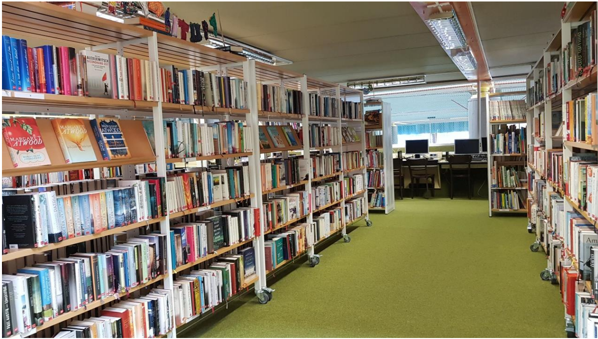
Abbildung 4: Bücherei mit Blick durch die Regale auf die Computer